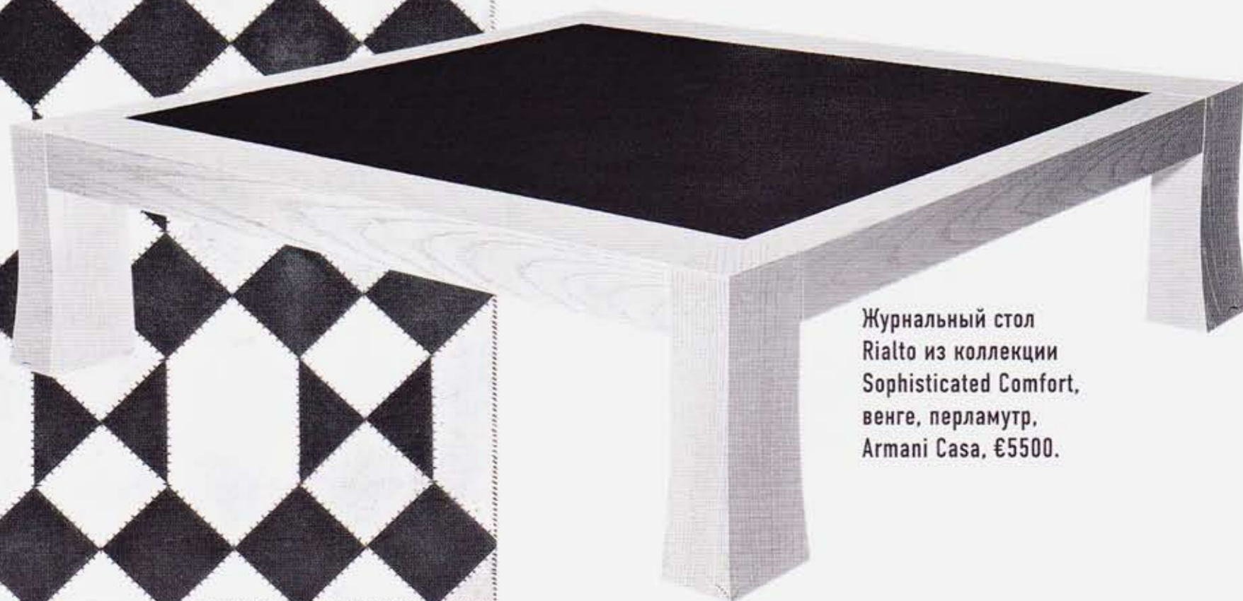
Журнальный стол Rialto из коллекции Sophisticated Comfort, венге, перламутр, Armani Casa, €5500.